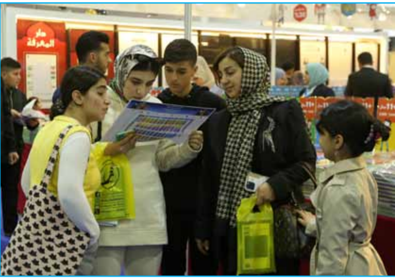
تصوير: محمود رؤوف